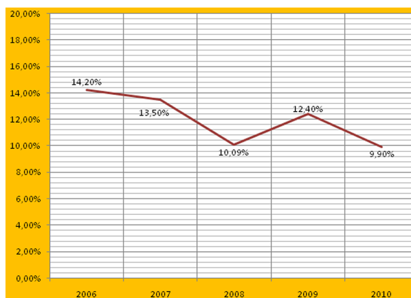
Figura 2. Porcentaje de internos con retraso mental (UPPQC).

más tuvieran retraso mental. Probablemente aquellos ingresos realizados por los pacientes con retraso mental serían producidos por alteraciones conductuales difíciles de filiar y que no corresponden a una sintomatología psiquiátrica clara.